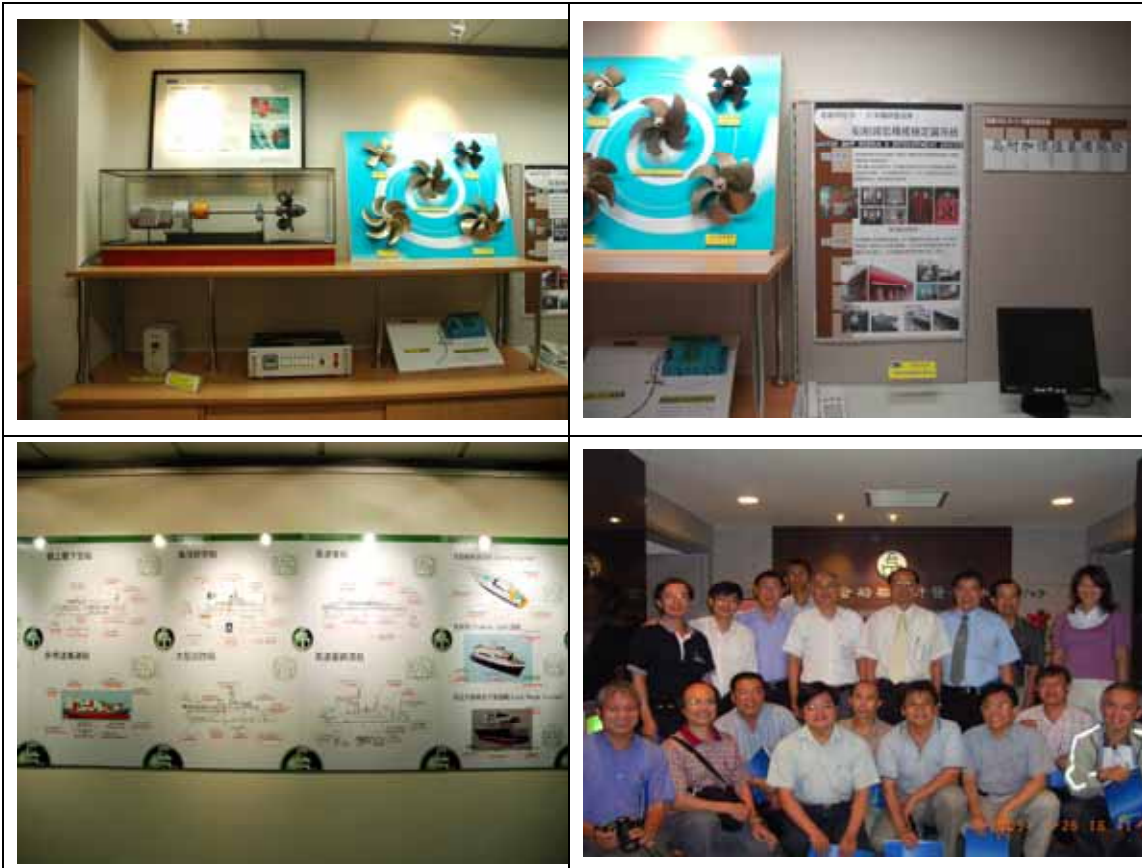
4. 94/7/27 宜蘭縣龍德造船廠參訪照片