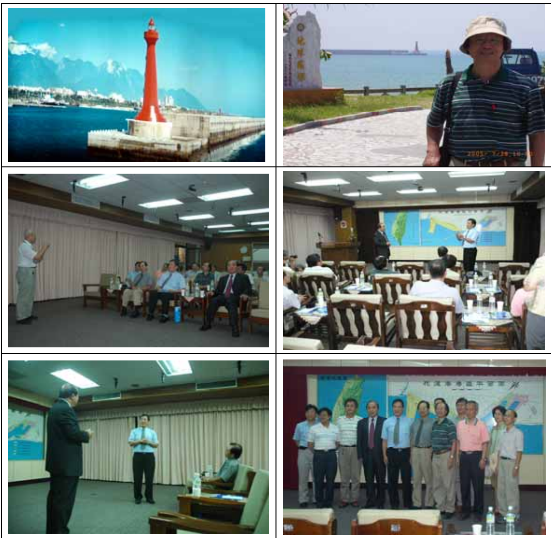
6. 94/7/29 屏東縣宏昇螺槳公司參訪照片